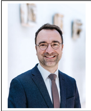
Heiko Jakobs, Bürgermeister der Stadt Bitburg